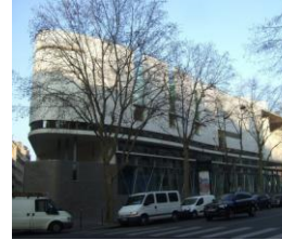
Illustration de l'innovation architecturale →

Les Journées du patrimoine ont entraîné, pour la 3 ème année consécutive, l'ouverture des portes du Lycée le samedi 15 septembre. Les visiteurs, dont, fort heureusement, quelques anciens élèves, ont pu ainsi admirer l'exposition permanente de la Cour d'Honneur sur «Carnot, lieu d'innovation et de création».